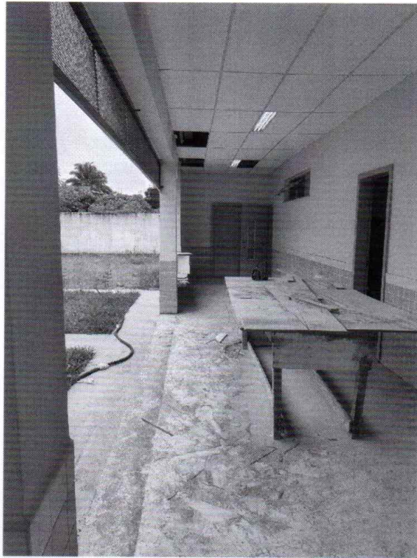
Creche Pro infância CORUMBÁ